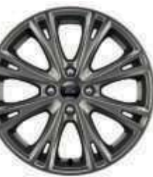
17"-Leichtmetallräder in Rock-Metallic (Wunschausstattung)