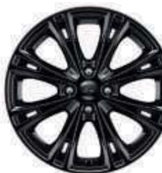
17"-Leichtmetallräder, schwarz lackiert (Wunschausstattung)