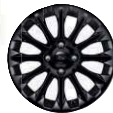
16"-Leichtmetallräder, schwarz lackiert (Serienausstattung)