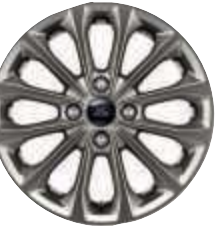
16"-Leichtmetallräder in Rock-Metallic (Serienausstattung)